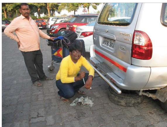
Bilen skulle lige fixes inden vi kunne køre.