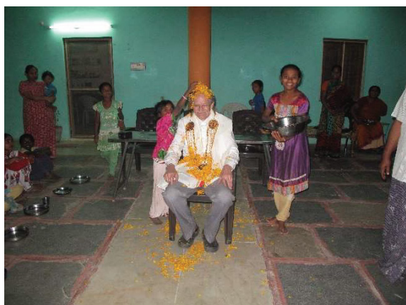
Fik en hjertelig velkomst til børnehjemmet. Fik drysset en masse blomster på hovedet.