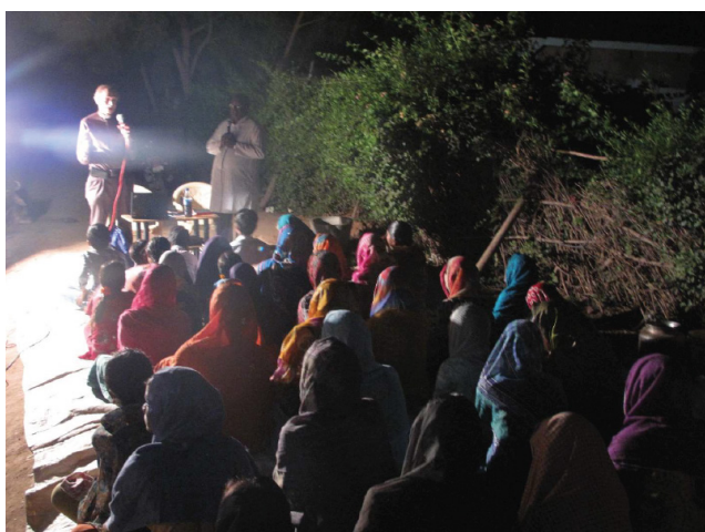
Onsdag den 15.02. Møde med søndagsskolekonsulent og forældreseminar i Yeleswarpura (udendørs møde)