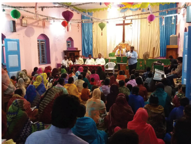
Mandag den 13.02. Gurazala gudstjeneste med fejring af fødselsdag (Præstens søn blev 5 år.)