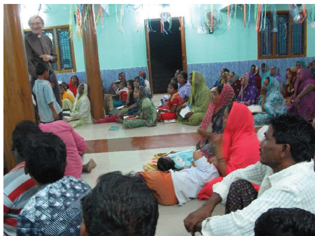
Tirsdag den 14.02. Tallur forældreseminar.