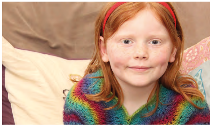
Gry på syv år savner nogle gange at se hendes forældre sammen.

- Skilsmisseforældre vil gerne spørges om opgaver i det kristne fællesskab. Det kan også være en god hjælp, hvis ledere vil hjælpe med at organisere, at forældre kan køre sammen til klub.